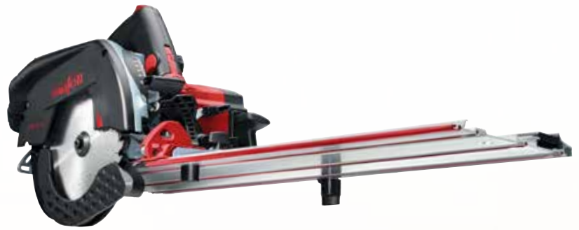
Kappschiene-Säge KSS 50 18M bl